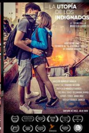
LA UTOPIA DE LOS INDIGNADOS Marcelo Lagreze (CHILE)